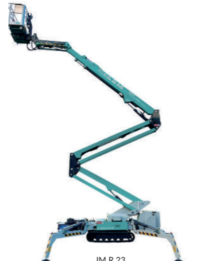
IM R 23

GAMME CENTRALES À BÉTON centrales de chantier, Distributeur de béton autonome