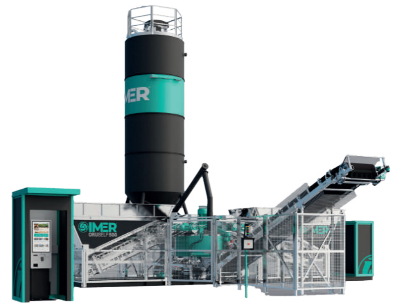
DISTRIBUTEUR AUTONOME DE BÉTON - ORUSELF