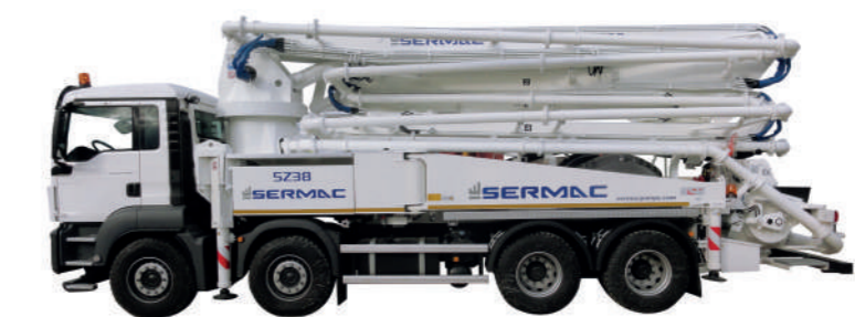
POMPES À BÉTON JUSQU'À 170 M 3 /H