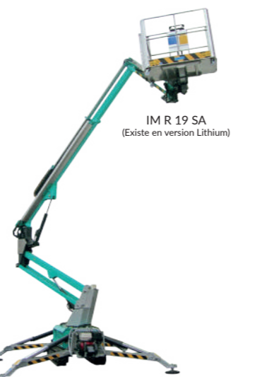
IM R 19 SA (Existe en version Lithium)