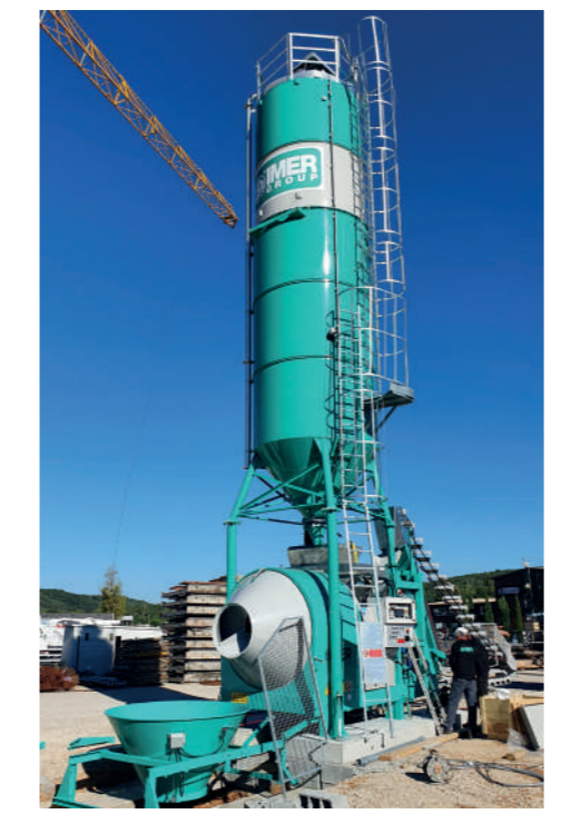
CENTRALES DE CHANTIER BTK

GAMME CENTRALES À BÉTON centrales de chantier, Distributeur de béton autonome