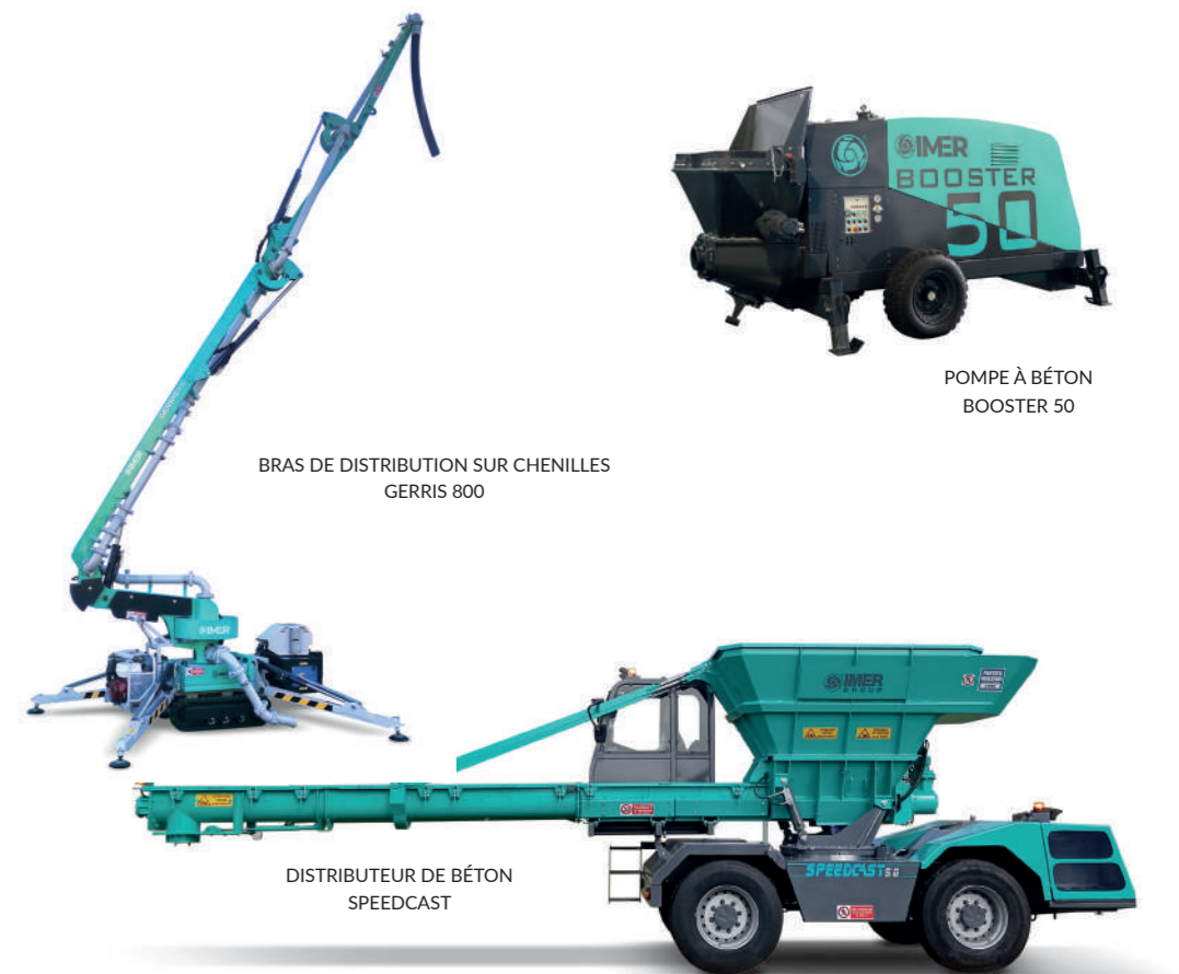
BRAS DE DISTRIBUTION SUR CHENILLES GERRIS 800