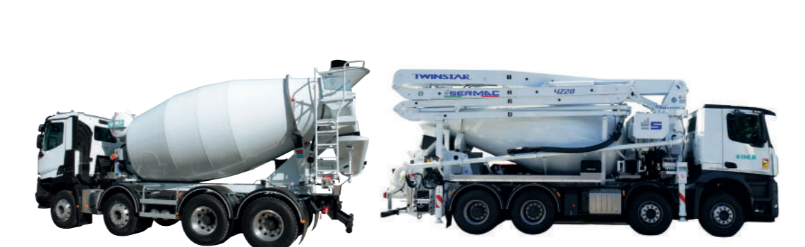
BÉTONNIÈRES PORTÉES DE 3.5 À 15 M 3 BÉTONNIÈRES PORTÉES SUR SEMI-REMORQUES 2 OU 3 ESSIEUX