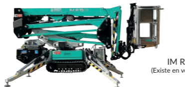
IM R 15 DA (Existe en version Lithium)