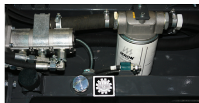
Réservoir d'huile hydraulique incorporé au châssis